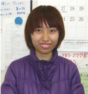
Aクラス マイティーさん (ベトナム)