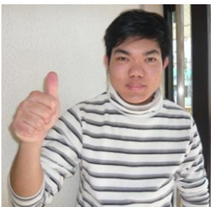
Cクラス ソーさん (ミャンマー)